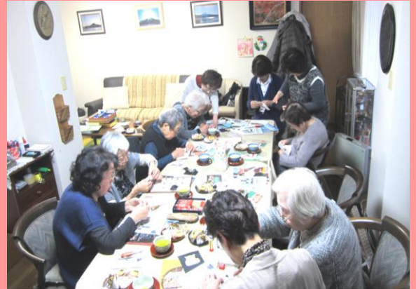
出来上がった作品を見ながら、一緒に盛り上がりませんか？