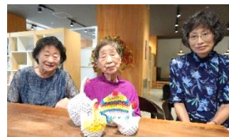
講師を務めた女性を囲んで