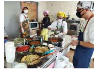
食品ロスをなくすため、予約制にしています