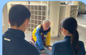
学生に車いすの操作を説明中

人の役にたっているということが何よりも嬉しいです。ボランティアをやってあげますというのではなく、やらせてもらいますと謙虚な気持ちは忘れないようにしています。