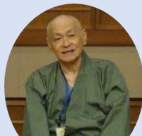
「白猿さん」の落語で会場は笑いと元気に包まれます

活動当初から、出囃子を担当しているお二人と一緒に落語をやっています。また、施設での麻雀指導の活動も行っています。