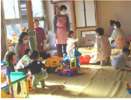
ゆったりと、子どもたちを見守ります!

子育て世代の助けになる場所 チャイルドサロンは、ボランティアが未就園児の預かり活動をしている全国でもめずらしい子育てサロンです。今年で25周年を迎えました。訪問したこの日は、子どもが16人、ボランティアは14人の参加があり、30畳ある広い和室は、たくさん笑顔があふれていました。ママと離れて一時的に泣く子もいますが、あたたかな雰囲気慣れれば、とびっきりの笑顔を見せてくれます。 初参加のボランティアは「子どもが好きで参加しましたが、笑顔に癒され、次回会えるのが待ち遠しい」と、保護者の方からは「家庭のような雰囲気です。子育ての先輩と話すだけで気持ちが楽になります」といった声を聞くことができました。